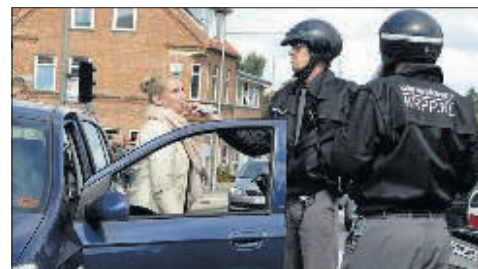
Den hollandske duo »Urban Safari« tog en tur rundt i byen iført politiuniformer. Her regulerede de blandt andet trafikken i krydset ved Algade/Københavnsvej, hvor en bilist blev tvunget til siden for at tage en »luft-prøve«.