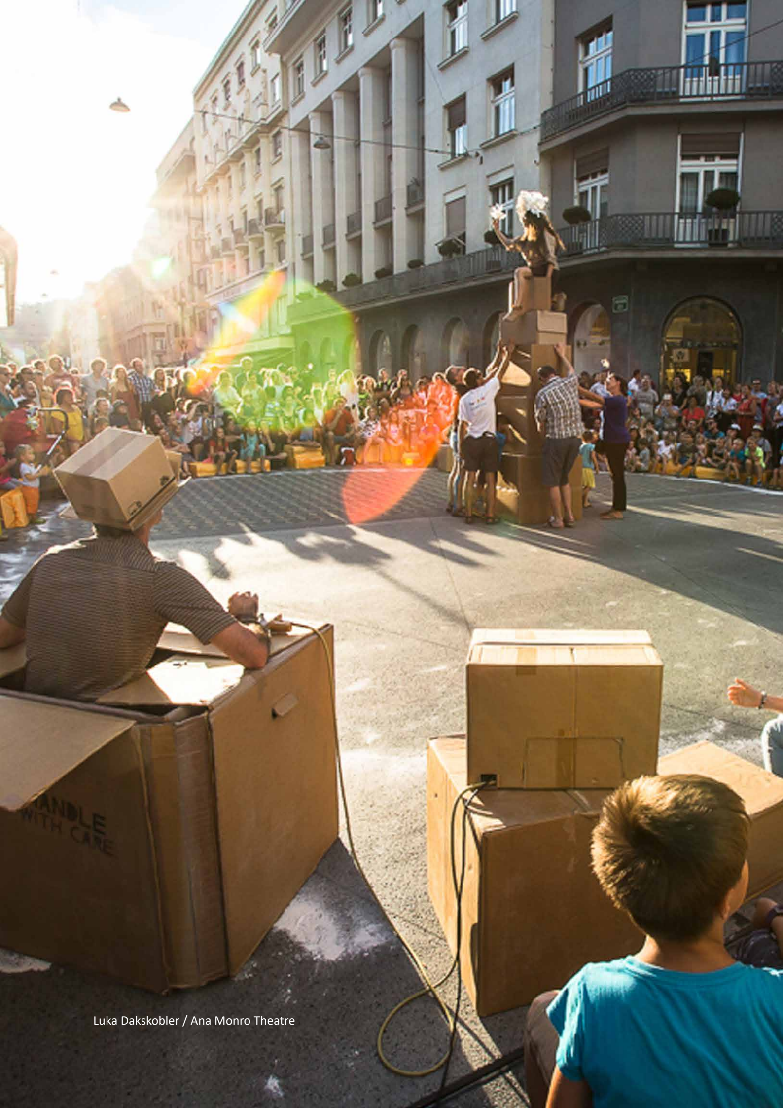
Luka Dakskobler / Ana Monro Theatre